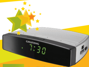
nr 15 Radiobudzik Czytelny radiobudzik z funkcją drzemki