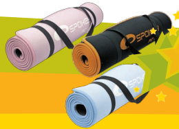
nr 10 Mata do ćwiczeń Spokey Mata do ćwiczeń fitness Spokey Flexmate. Wymiary: 180 x 60 x 0,6 cm