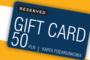
nr 28 Reserved 50 zł