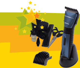
nr 9 Maszynka do włosów Maszynka do strzyżenia marki First z różnymi końcówkami