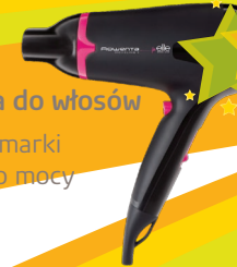
nr 17 Suszarka do włosów Suszarka marki Rowenta o mocy 1500 W