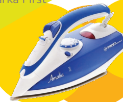
nr 22 Żelazko Marka First