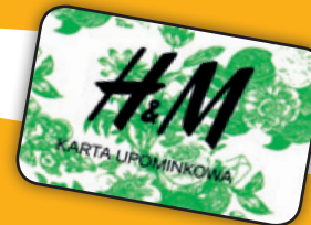
nr 25 H&M 50 zł