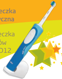
nr 18 Szczoteczka elektryczna Szczoteczka do zębów Braun D12 Vitality