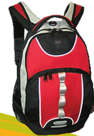
nr 13 Plecak miejski Przykładowa marka: Semi-Line