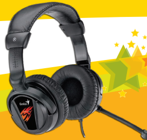
nr 16 Słuchawki Słuchawki Genius HS-G500V