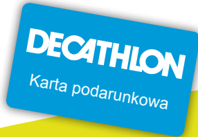
nr 23 Decathlon 50 zł