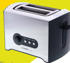
nr 20 Toster Marka First