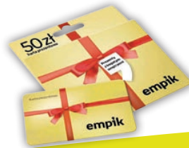
nr 24 Empik 50 zł