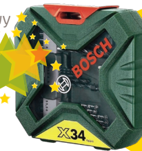
nr 21 Zestaw akcesoriów Bosch X-Line 34 - elementowy zestaw wiertel i końcówek wkręcających X-Line