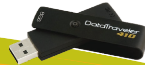
nr 12 Pendrive (min. 4 GB) Przykładowa marka: Data Traveler