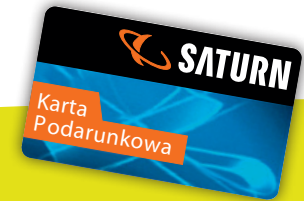
nr 26 Saturn 50 zł