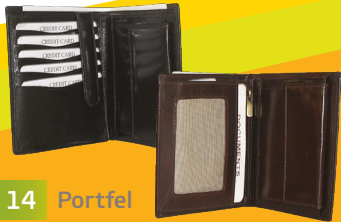
nr 14 Portfel Różne modele: męski lub młodzieżowy