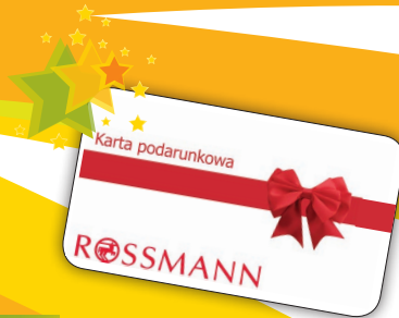
nr 29 Rossmann 50 zł